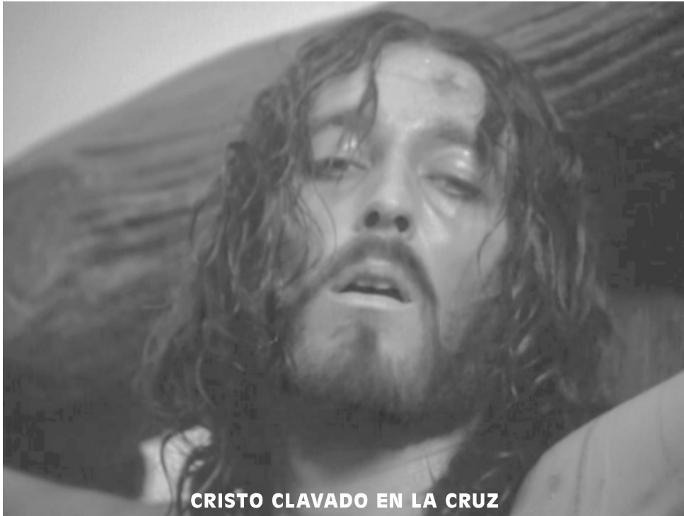
CRISTO CLAVADO EN LA CRUZ

palabras: «Soy cristiana, no, no; entre nosotros no se comete delito alguno». Fue clavada en un poste, entregada a las fieras, llevada de nuevo al anfiteatro con un joven de quince años llamado Póntico, y con él murió tras inauditos tormentos» ( Ruinart ).